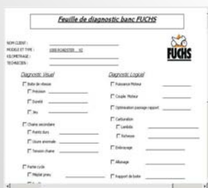
Feuille de diagnostic client