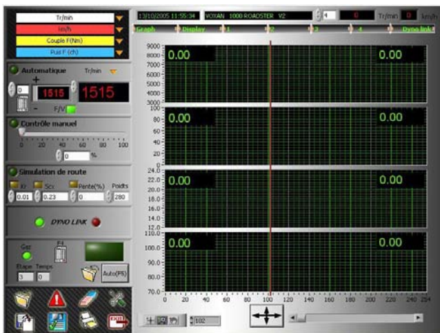
Simulation, acquisition de données