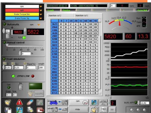
Optimisation cartographie d'injection

Avec le Frein d'endurance (à courant de Foucault), le banc d'essais devient un véritable banc de simulation , intégrant les différentes lois de roulage (pente, poids sur le véhicule + pilote, Scx, coefficient de roulement, gravité). Il est également possible de créer des scénarii complets de cycles de roulage et effectuer des stabilisations de régime extrêmement précises.